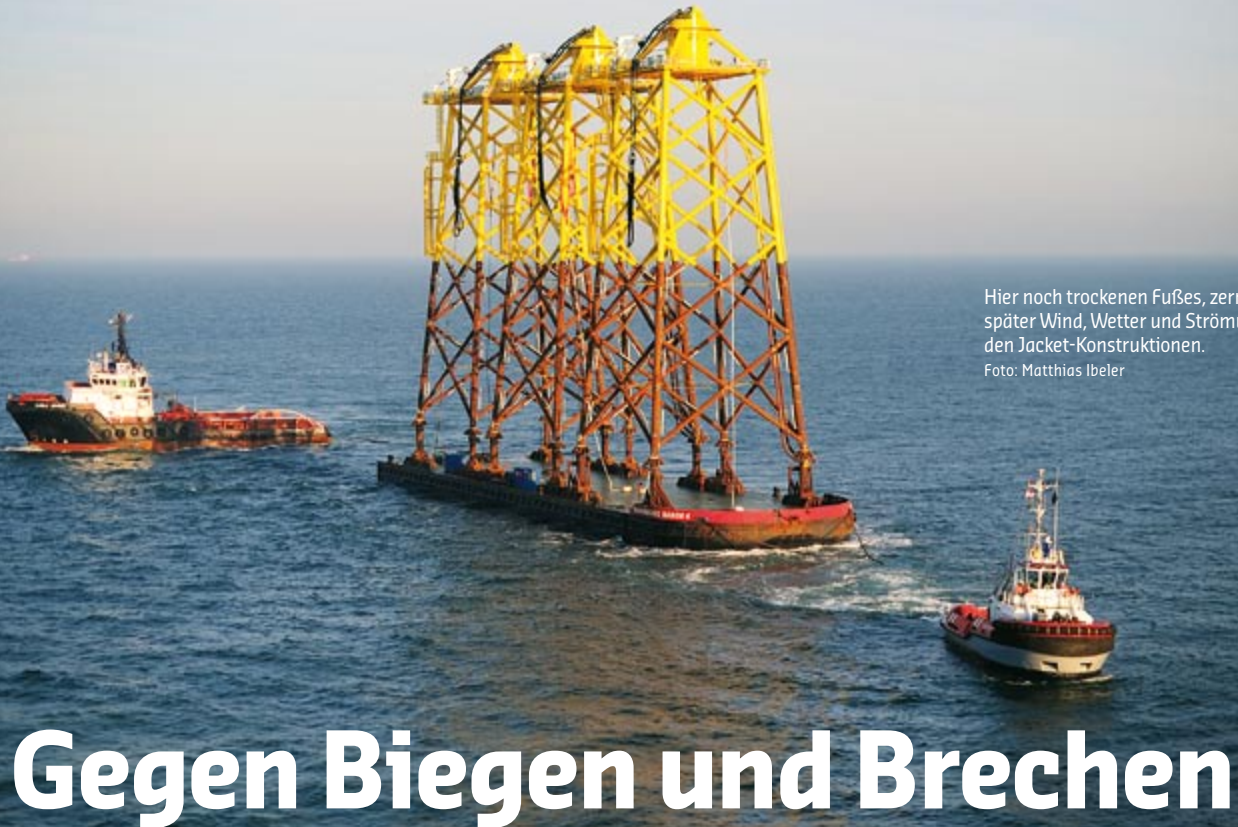
Hier noch trockenen Fußes, zeren später Wind, Wetter und Strömung an den Jacket-Konstruktionen.