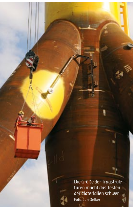
Die Größe der Tragstrukturen macht das Testen der Materialien schwer.

nutzt werden. Doch die Herstellung von Gussknoten ist teuer. Sie wirtschaftlicher zu machen, auch darum soll es im Testzentrum gehen.